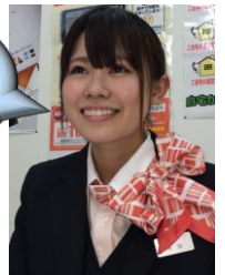
お客様へのこころをこめた挨拶も大切な仕事です。