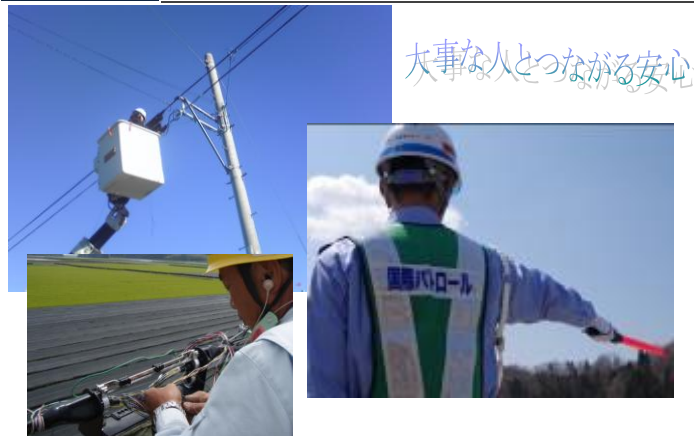
通信事業者の回線メンテナンス工事に伴う警備