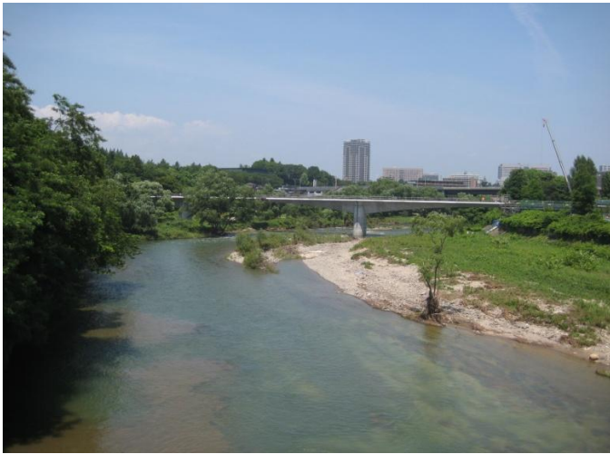
当社で施工した橋梁の例 地下鉄東西線広瀬川橋梁（仙台市）