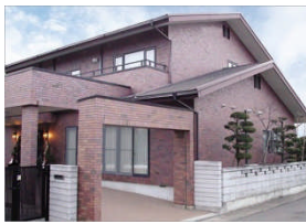
この他民間商業施設の実績も多数あります。